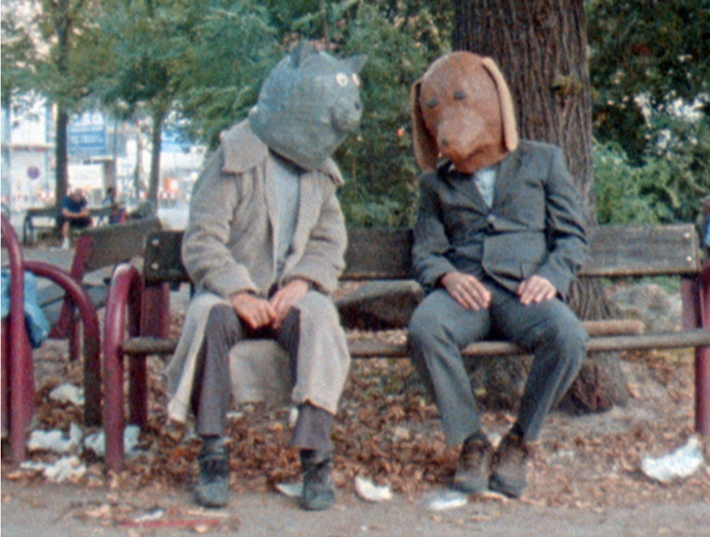
Gernot Wieland, Thievery and Songs , 2016, vidéo 16:9, 22'40''

Sous les traits fantaisistes d'un narrateur qui se transforme en escargot, Gernot Wieland propose un autoportrait psychique tout en délicatesse et ironie. Entre rêve et réalité, images mentales et performances, l'artiste autrichien entrechoque les références, de la Sonde Voyager envoyée à l'adresse des extra-terrestres en 1977 au Mouvement de contestation pacifique Occupy Wall Street.